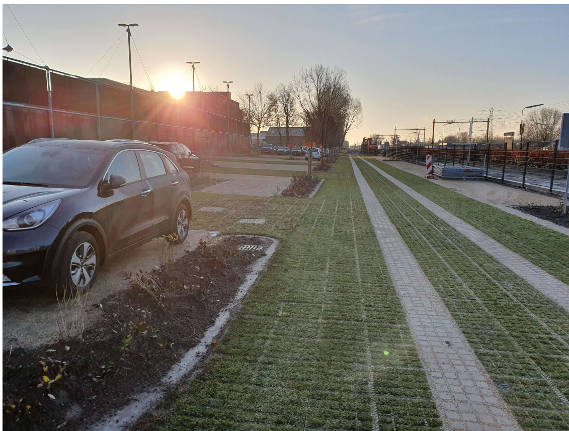
TTE Systeem 4-Sporigheid Delft