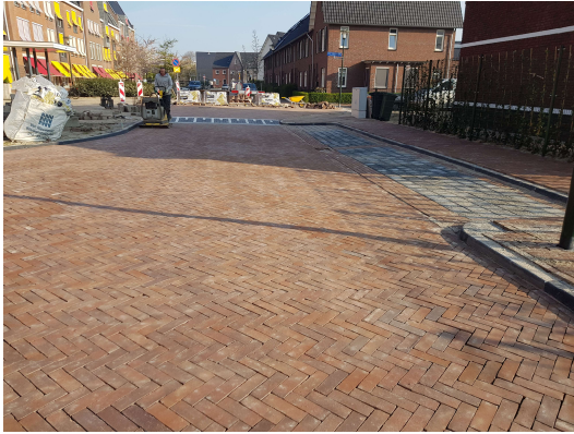
WRM het dorp Poeldijk

Voor meer informatie en foto's van de projecten kun je kijken op onze website: http://www.groeneveldgww.nl/projecten/