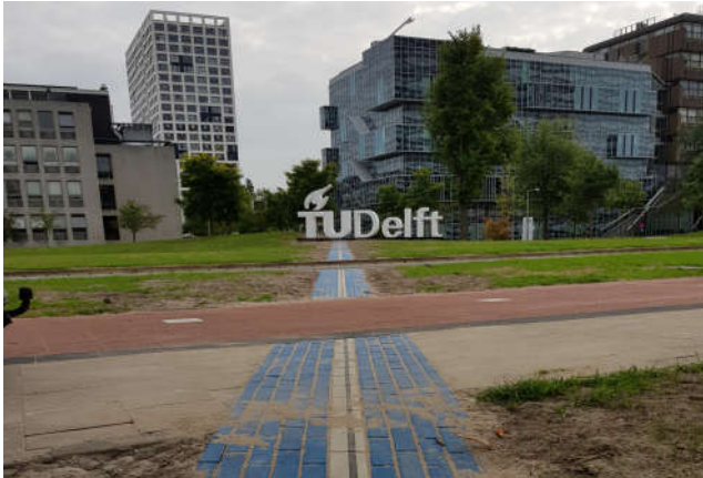
Aanleg 52° breedtegraad TU Delft