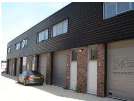
Foto kantoorlocatie Maasdijk

In verband met de grote hoeveelheid werk in het Westland en omstreken is per 3 april een nieuwe vestiging in gebruik genomen aan De Derde Hoeve 54, 2676CS in Maasdijk. Vanuit hier zullen de werkzaamheden in het Westland worden gecoördineerd en dit is tevens onze nieuwe "hoofdvestiging". De vestiging in Capelle zal gehandhaafd blijven voor de administratie en ook voor aansturing van de werkzaamheden in of nabij Gemeente Giessenlanden.