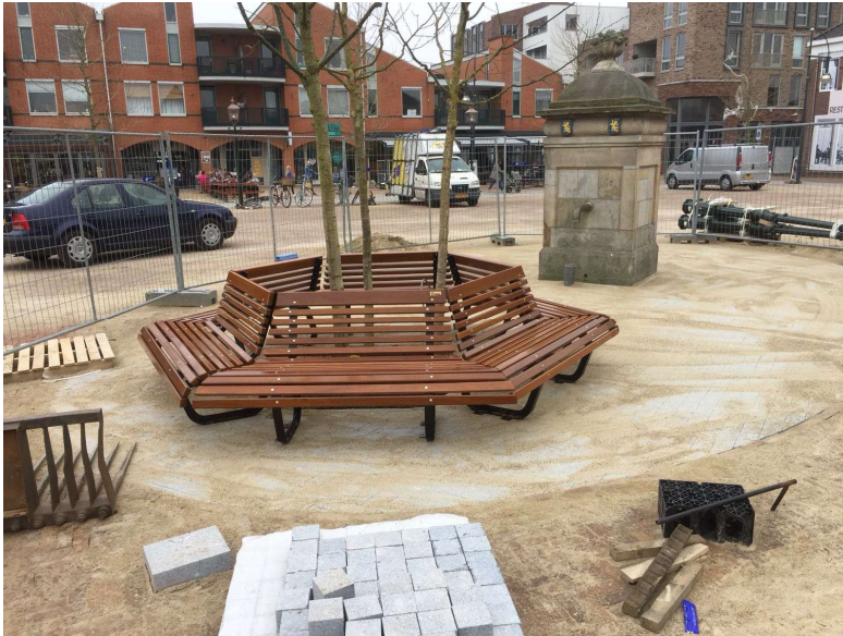
Waterpomp Marktpllein 's-Gravenzande